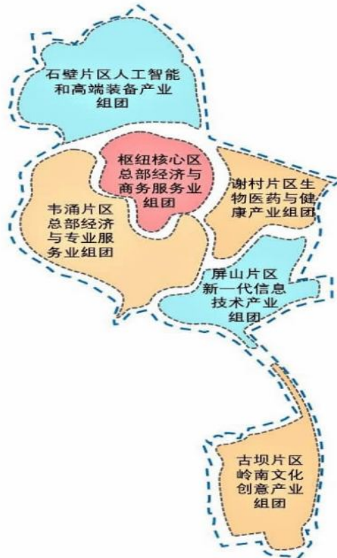
图3 南站地区产业规划布局图

按照高铁枢纽圈层发展规律和相对集中、联动发展要求，基于地区产业发展现状，南站地区将着力构建总部经济与商务服务、总部经济与专业服务、生物医药与健康、人工智能与高端装备、新一代信息技术、岭南文化创意等六大产业组团。