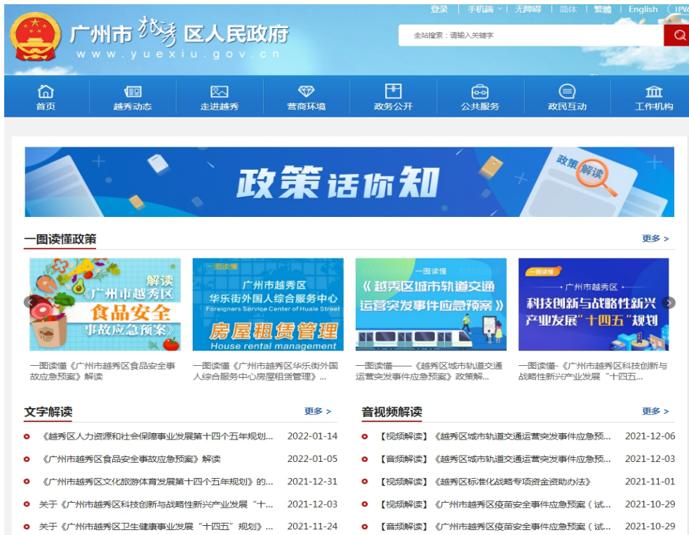
图 1 越秀区多种形式政策解读