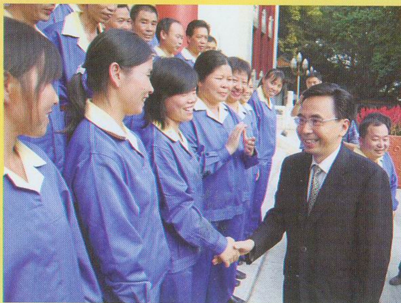
省委常委、市委书记朱小丹亲切接见“优秀城市美容师”代表。▶