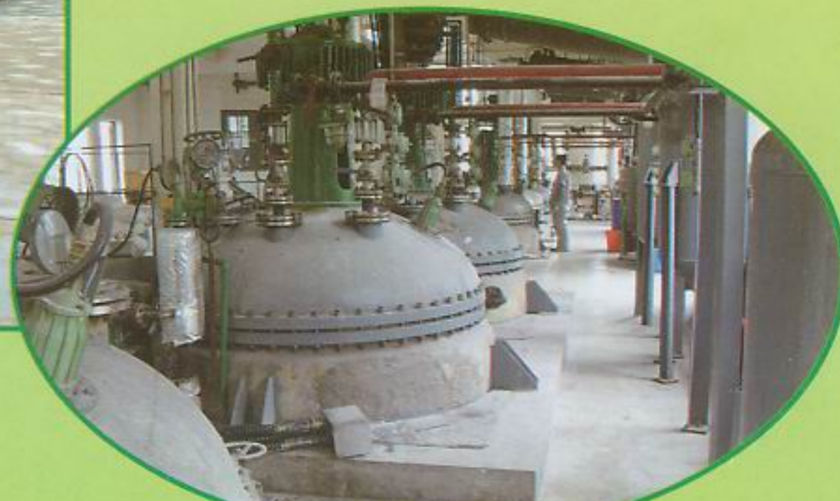
黄埔化工厂的生产线

编辑: 《广州政报》编辑部 地址: 市政府一号楼112室 邮编: 510032 咨询电话: 83123438 投稿电话: 83123238