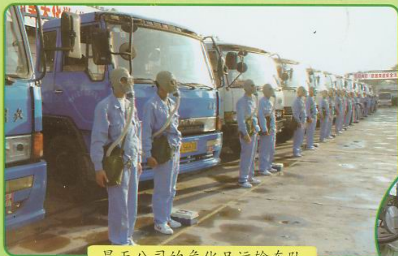
昊天公司的危化品运输车队