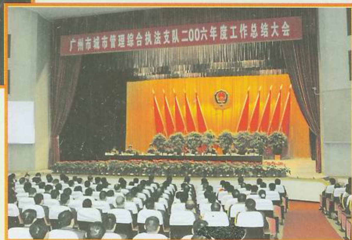
广州市城市管理综合执法支队二〇〇六年度工作总结大会