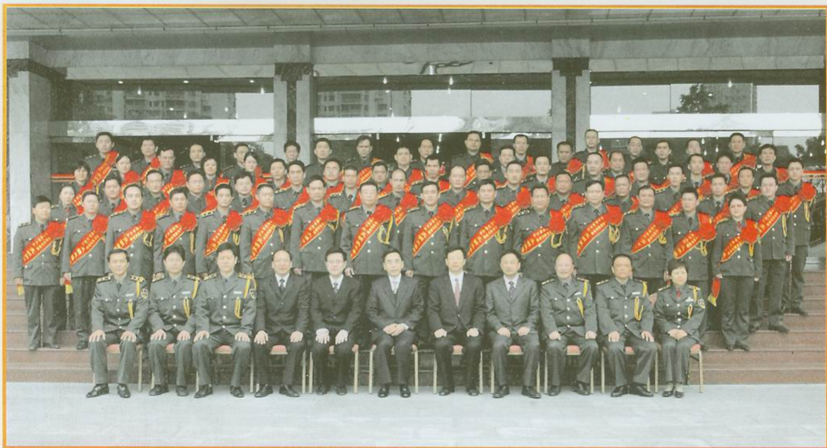
省、市领导与城管综合执法支队合影