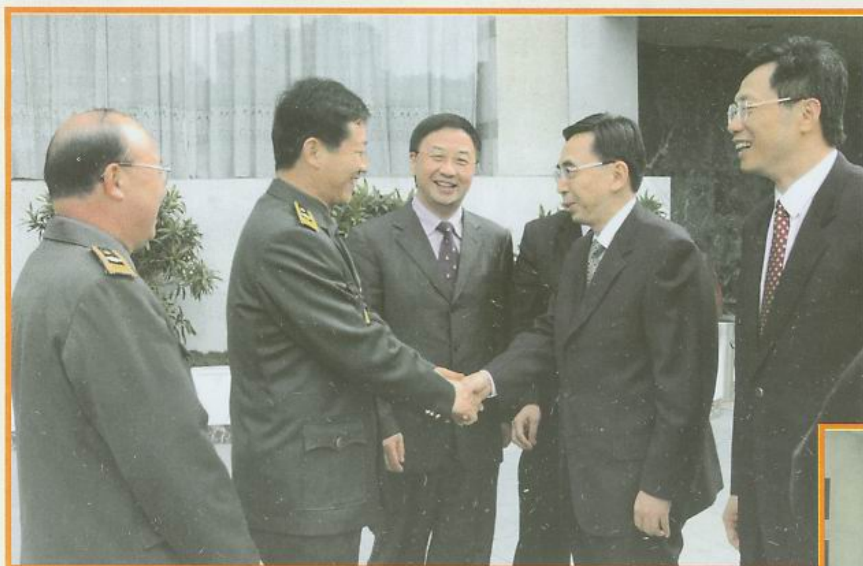
省、市领导亲切关怀城管队伍