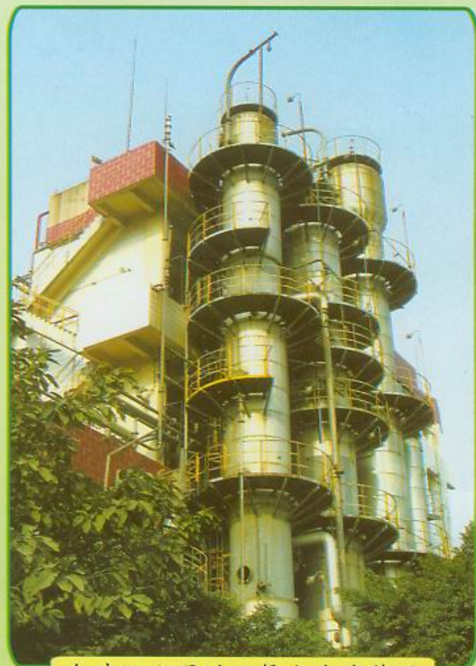
金珠江公司的双氧水生产装置