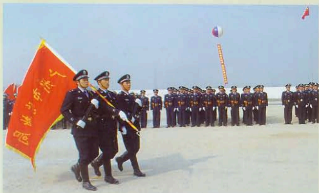
▲ 迎接队旗庄严肃穆

2007年2月8日，我市劳教局在广州市潭岗劳教所训练场举行了声势浩大而富有成效的岗位练兵阅警活动，近千名干警参加了活动。仪式上，12支装备精良、整齐划一的方阵以昂扬向上的警容风貌接受了领导的检阅，并展示了队列动作与指挥、警棍盾牌操、擒敌拳和擒拿格斗的警体技能，充分展示了我市劳教系统深入开展岗位练兵活动取得的可喜成果，展示了我市劳教人民警察良好的精神风貌。