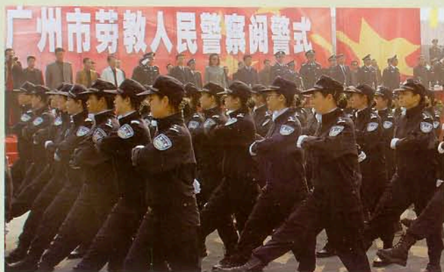
▲ 戎装女警英姿飒爽