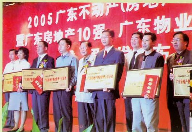
2005年度物业管理十佳颁奖

州市最大的房改房物业管理龙头企业。公司现有员工217人，管理人员有53人，大专以上学历文化程度达51%，均获得国家或市物业管理行业主管部门核发的上岗证。