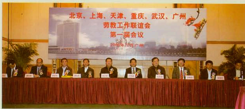
▲ 6大城市劳教工作有关领导汇聚一堂

2006年12月14日，由我市劳教局首倡的6大城市劳教工作联谊会第一届会议在广州市白天鹅宾馆隆重举行。6大城市劳教局主要领导及代表共聚一堂，共商劳教工作发展大计，并审议签署了劳教工作合作协议，从而在合作方面达成了共识，搭建了共同发展、加强合作的工作平台，为6大城市劳教单位加强交流、合作培训、资源共享提供了制度性的保障。