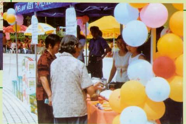
便民义诊、咨询、促销活动