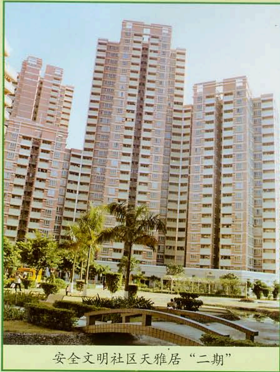
安全文明社区天雅居“二期”

广州教育物业管理有限公司为广州市教育局所属企业，主要负责广州市教育局新建教师住宅小区物业管理工作，随着，新建教师小区接管工作逐步结束，公司已将工作重点转变为积极向外拓展业务，接管社会招标物业管理工作。