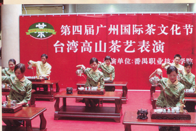
学生茶艺队在第四届广州国际 茶文化节开幕式上表演台湾高山茶茶艺