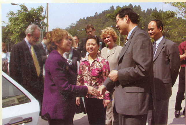
英国教育国务大臣与 院领导商谈中英教育合作项目