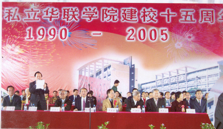
▲ 庆祝华联成立十五周年大会