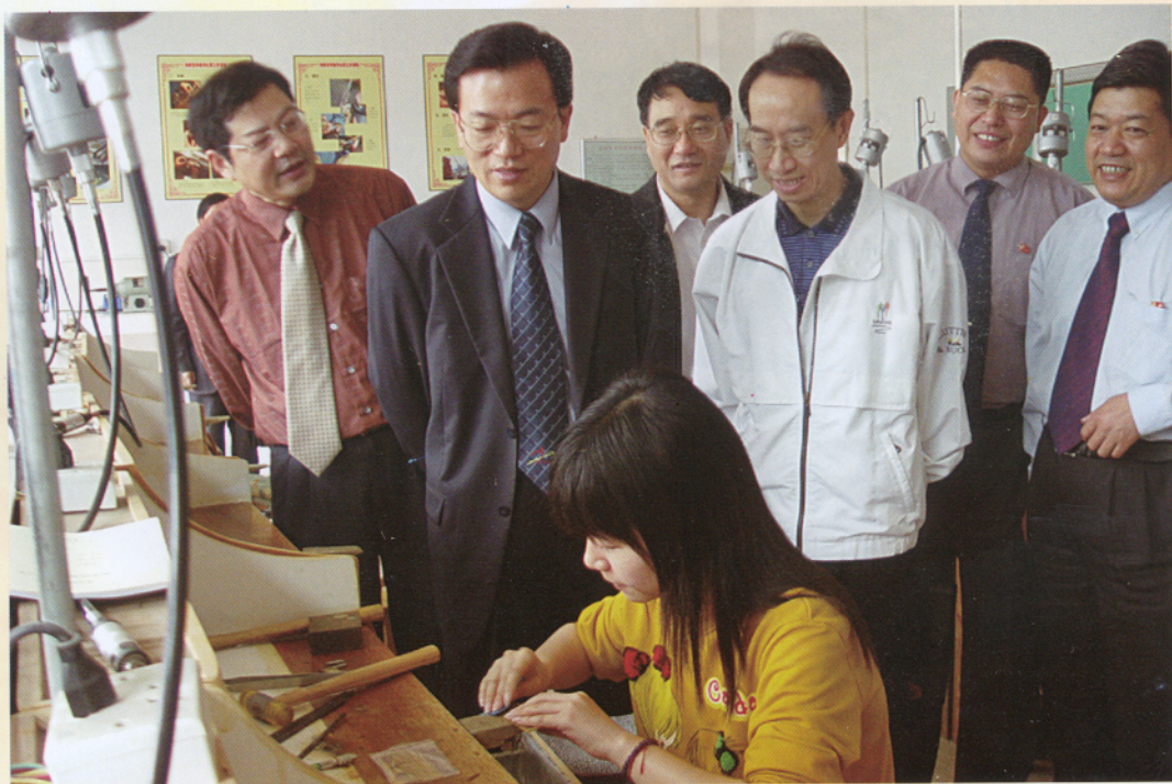
李卓彬副市长视察学院