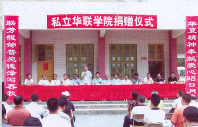
▲ 华联向怀集山区小学捐赠

在过去的十六年中，学校采取减交、缓交、奖励等方式共资助将近1000万元让贫困生完成学业，创校时老教授们“让尽可能多的人有机会读大学”、“教育可以改变命运”的初衷正在不断实现。“名私不为私”、“名私不谋私”是私立华联学院的真实写照。