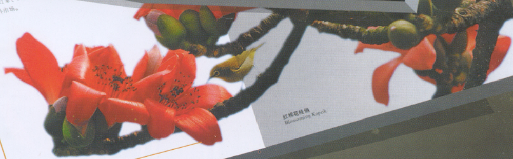
红棉花枝俏 Blossoming Kapok

一、西药。 产荔枝、龙眼、番 附生须叶植物。如榴莲花。 场一半以上。打拿、顿顿二 销欧美等海外市场。