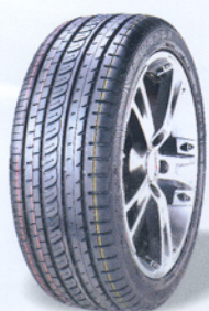
华南轮胎生产的绿色环保子午线轮胎

“节能、降耗、减污、增效”，在此方针指引下，华轮已经收获良多。今后华轮还将通过淘汰落后设备，建立资源利用高效化、物质消耗减量化的高效生产体系，实施绿色照明工程等等系列措施减少能源消耗、减少污染物排放，力争在节能和减排上取得更大的成绩。