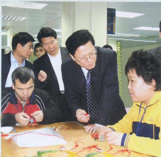
2007年2月15日，广州市委副书记、市长张广宁，在副市长陈国等领导陪同下，来到市残疾人服务机构，慰问在那里进行康复训练、工疗和学习的残疾人和家属及残疾人工作者。