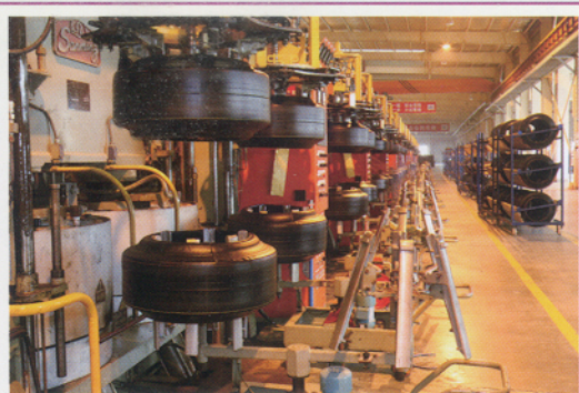
干净整洁的硫化车间

经过废水处理站处理的污水还能养活金鱼，这是华轮在废水处理方面收获一个佳话。华轮投资约100万元对污水处理系统进行改造，采用SBR物化与生化两级处理工艺技术，形成废水日处