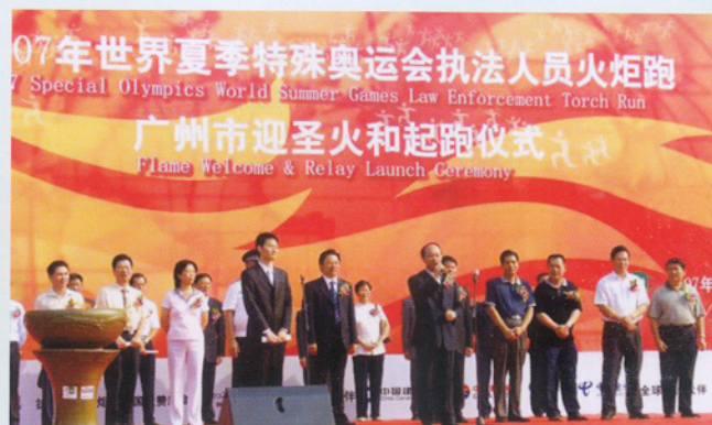
2007年9月27日上午，广州市在天河体育中心西南门广场举行2007年世界夏季特殊奥运会执法人员火炬跑广州市迎圣火和起跑仪式。广州市委常委、常务副市长苏泽群点燃了火炬，并宣布特奥火炬跑广州迎圣火和起跑开始。

市政府领导在会议中谈到在市委、市政府的重视和支持下，我市残疾人事业取得了较好的成绩。我市计划在2008年底前实现每个街道至少有1个面积不少于60平方米的康园工疗站，为有需要的智力和精神残疾人提供日间托养、康复和工疗服务。使我市残疾人托养服务工作形成立体式、网络化的工作局面。