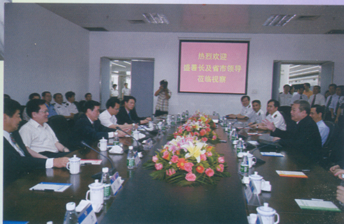
▲ 盛光祖署长参加座谈会。