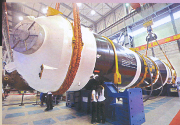
▲ 东方电气（广州）重型机器有限公司生产车间。