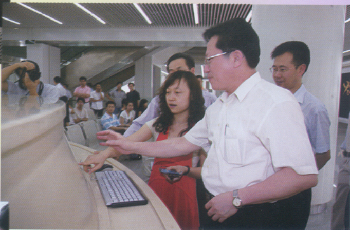
▲ 张广宁市长视察南沙港区报关报检大厅。