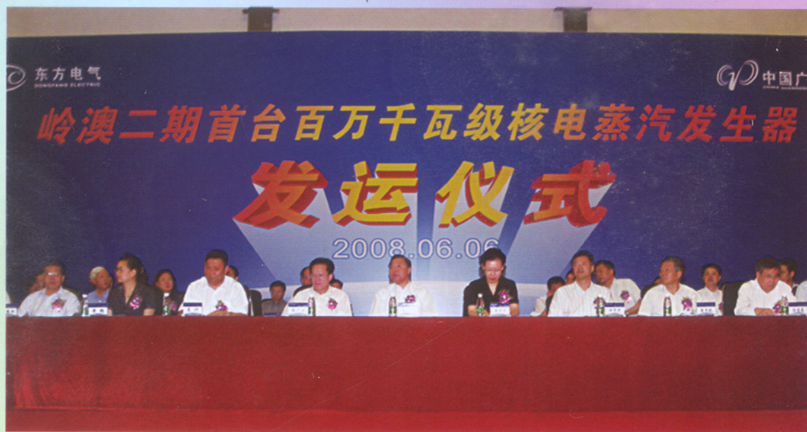
▲ 岭澳二期首台百万千瓦级核电蒸汽发生器发运仪式6月6日上午在广州南沙举行。