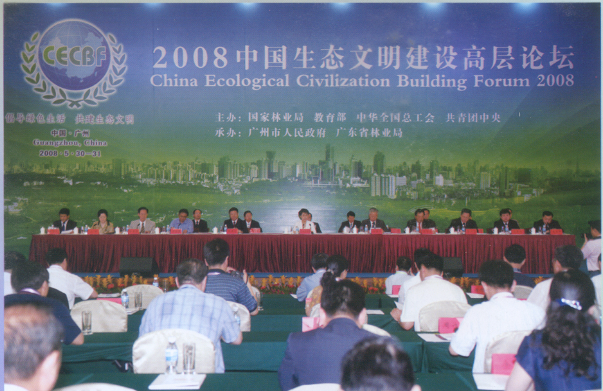
▲ 2008中国生态文明建设高层论坛5月30日上午在广州白云国际会议中心隆重开幕。