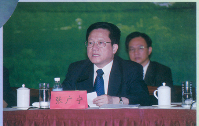
▲ 广州市委副书记、市长张广宁在开幕式上致辞。