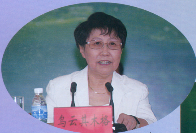
▲ 全国人大常委会副委员长 乌云其木格出席会议并讲话。