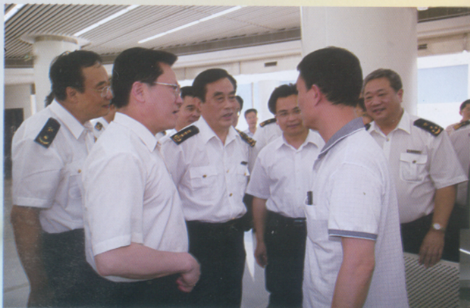
▲ 5月28日下午，张广宁市长（左二）陪同海关总署盛光祖署长（左四）到广州南沙港区考察。