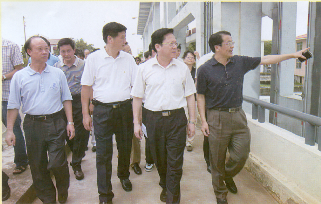
▲ 6月16日上午，广州市市长张广宁到番禺区检查防汛工作。