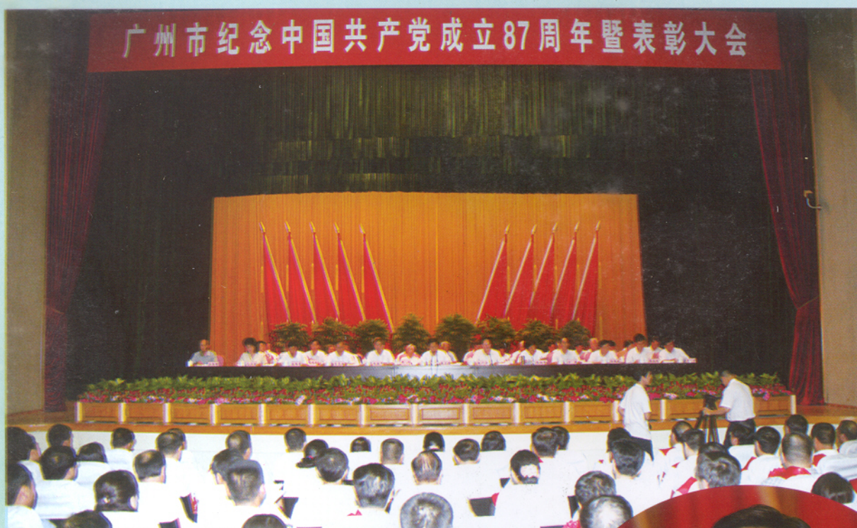
▲ 6月30日，市委隆重召开纪念中国共产党成立87周年暨表彰大会。