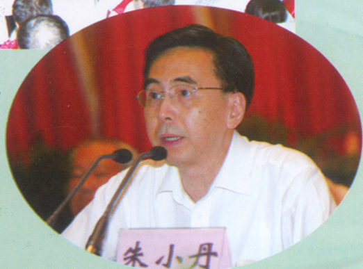
▲ 省委常委、广州市委书记、市人大常委会主任朱小丹出席大会并作讲话。