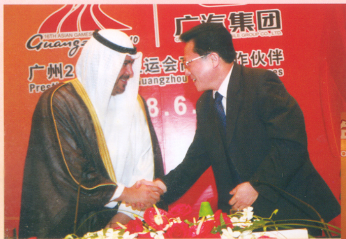
▲ 亚奥理事会主席艾哈迈德·法赫德·萨巴赫亲王（图左）和广州亚组委副主席兼秘书长、广州市市长张广宁（图右）亲切握手。