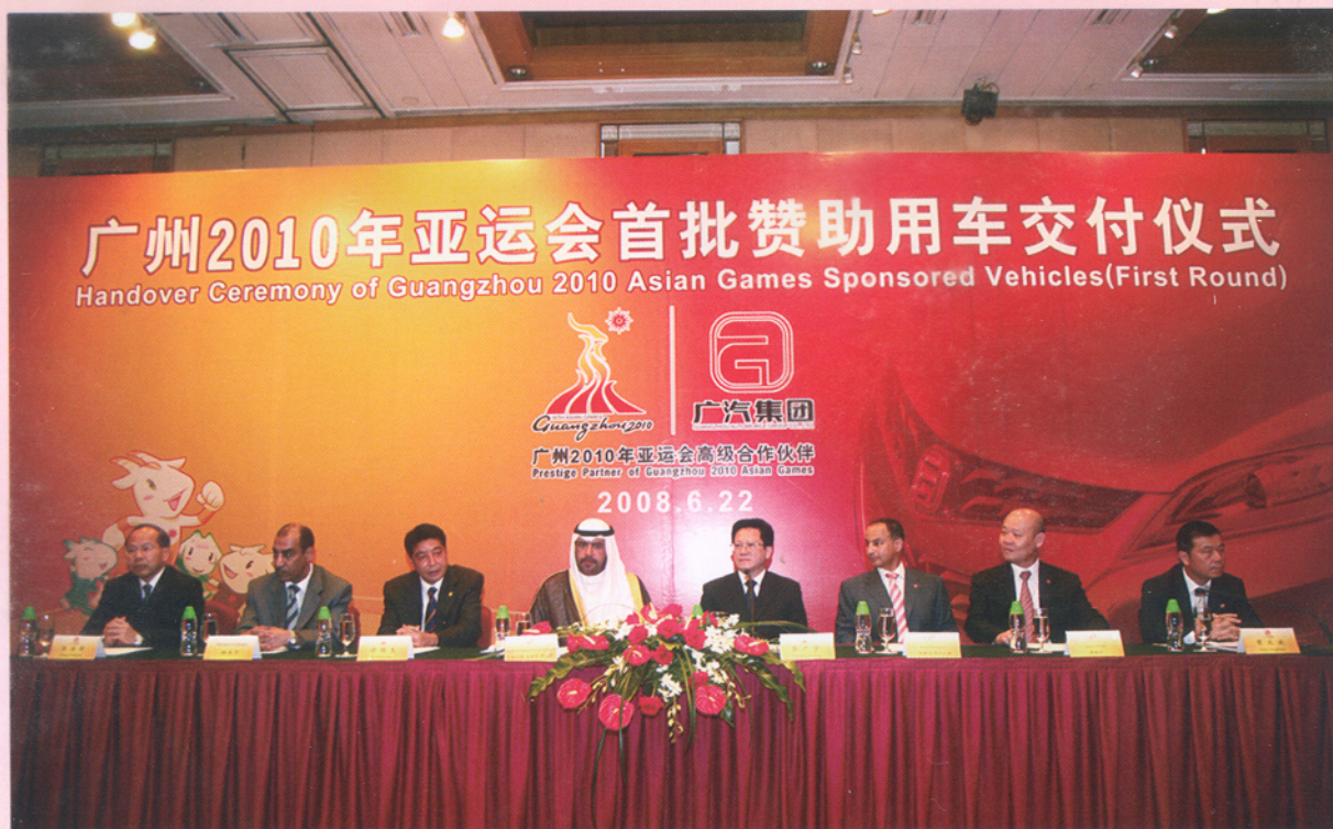
▲ 6月22日，“2010年亚运会首批赞助用车交付仪式”在广州隆重举行。广州亚运会高级合作伙伴广州汽车集团股份有限公司向广州亚组委交付了首批20辆赞助用车钥匙。