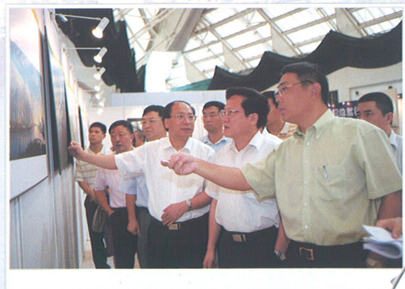
◆ 张广宁市长浏览参赛图片。