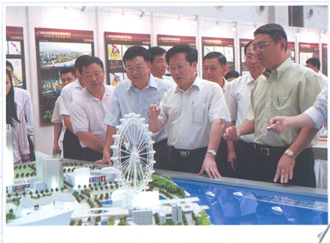
◆ 张广宁市长观看设计模型。