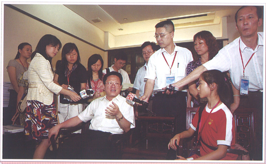
▲ 张广宁市长与走进市长办公室参观的市民代表亲切交谈。