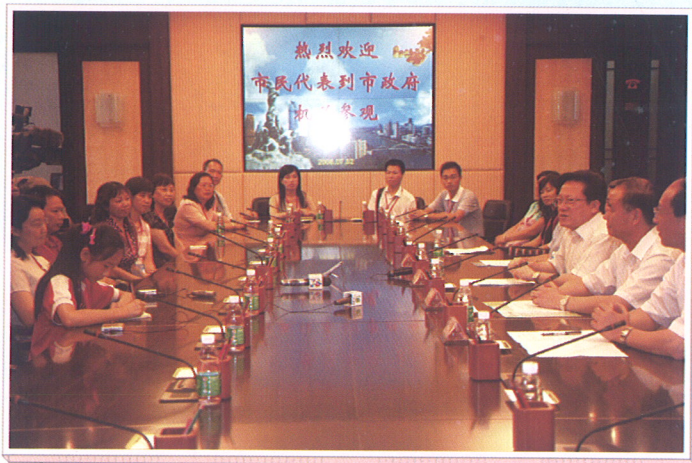
▲ 7月2日，市政府接待参观市民。