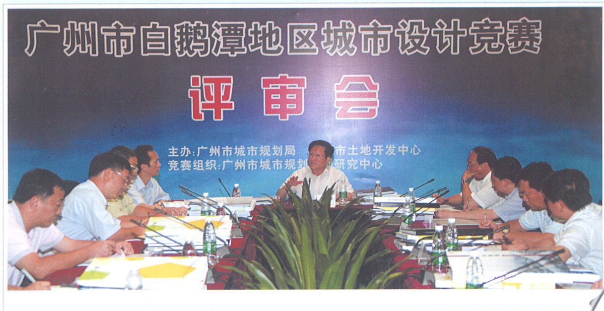
◆ 7月15日，张广宁市长主持广州市白鹅潭地区城市设计竞赛评审会。