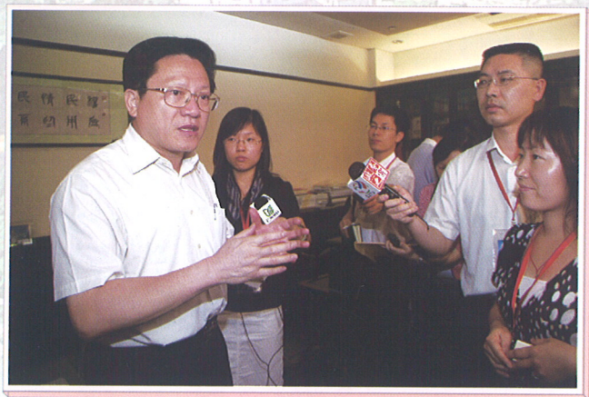
▲ 张广宁市长接受采访。