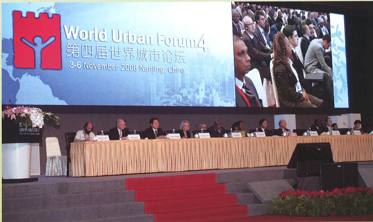
▲ “第四届世界城市”论坛11月3日在南京开幕。