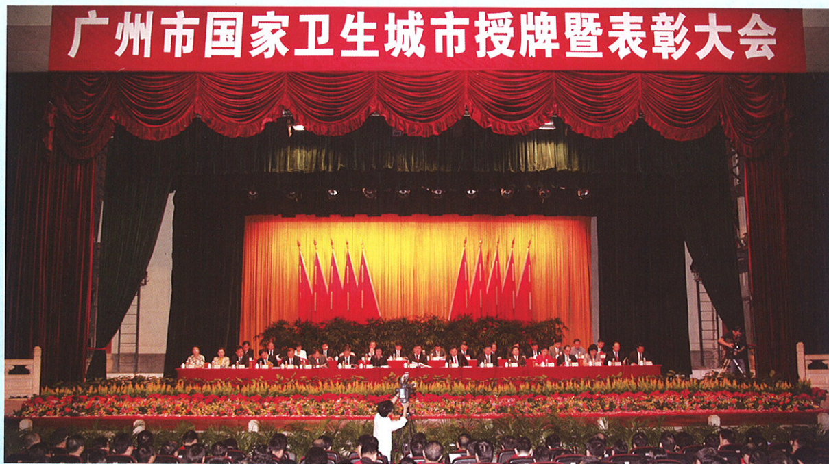
▲ 11月4日上午，广州市委、市政府在中山纪念堂隆重举行国家卫生城市授牌暨表彰大会。