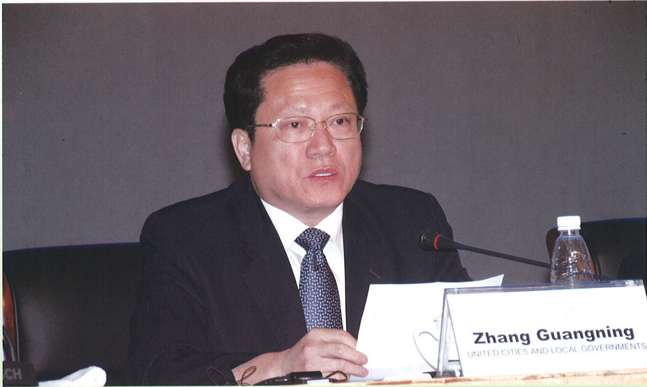
▲ 张广宁市长出席“第四届世界城市”论坛并致辞。