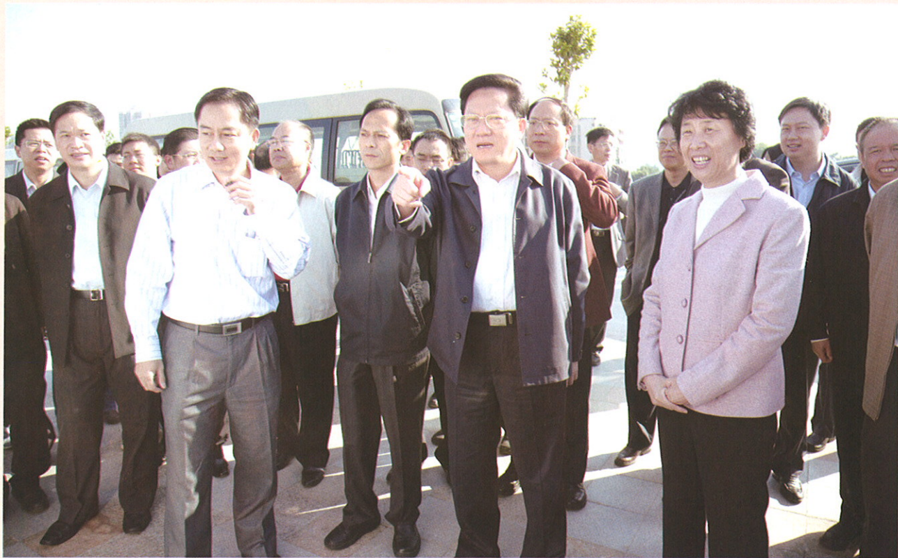
▲ 11月12日上午，张广宁市长一行来到荔湾区花地河实地检查。