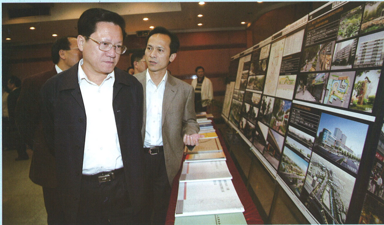
▲ 张广宁市长在视察。

编辑出版：《广州政报》编辑部 地址：市政府一号楼112室 广告经营许可证：穗工商广字01025