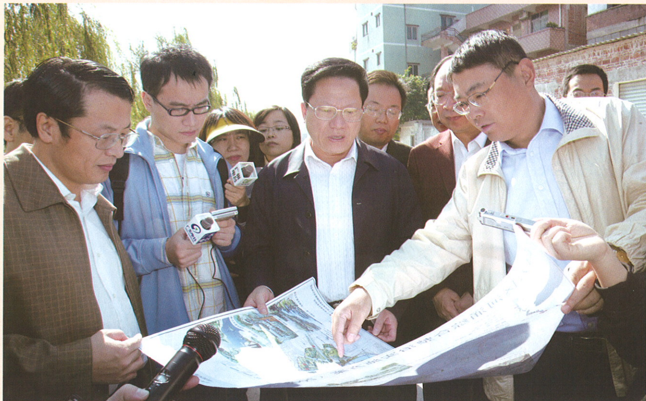
▲ 张广宁市长在视察。