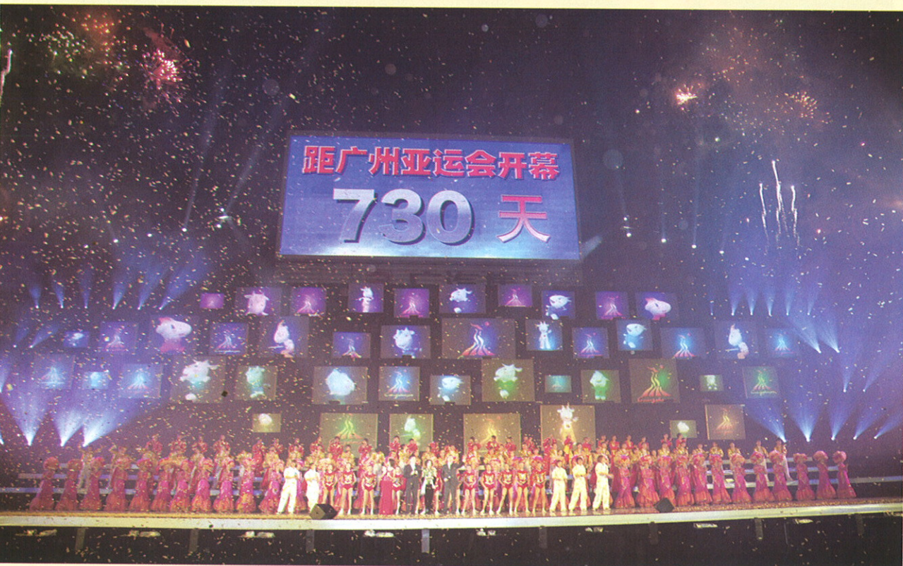
▲ 巨大的倒计时牌亮起，广州2010年亚运会正式跨入了两周年的倒计时，广州进入了亚运时间！