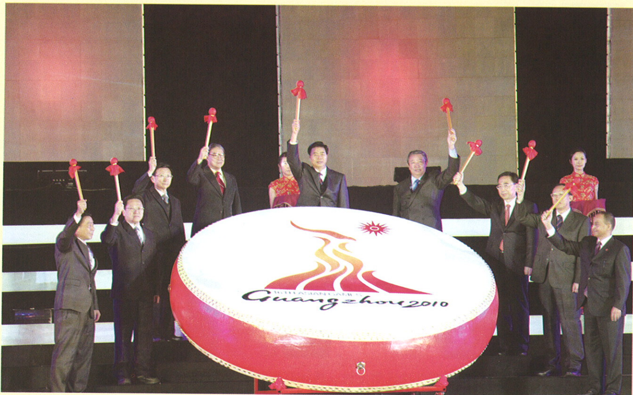
▲ 11月12日晚上，在烟花绽放的天河体育中心，在万众欢腾的倒数声下，领导嘉宾们敲下倒计时的鼓槌。