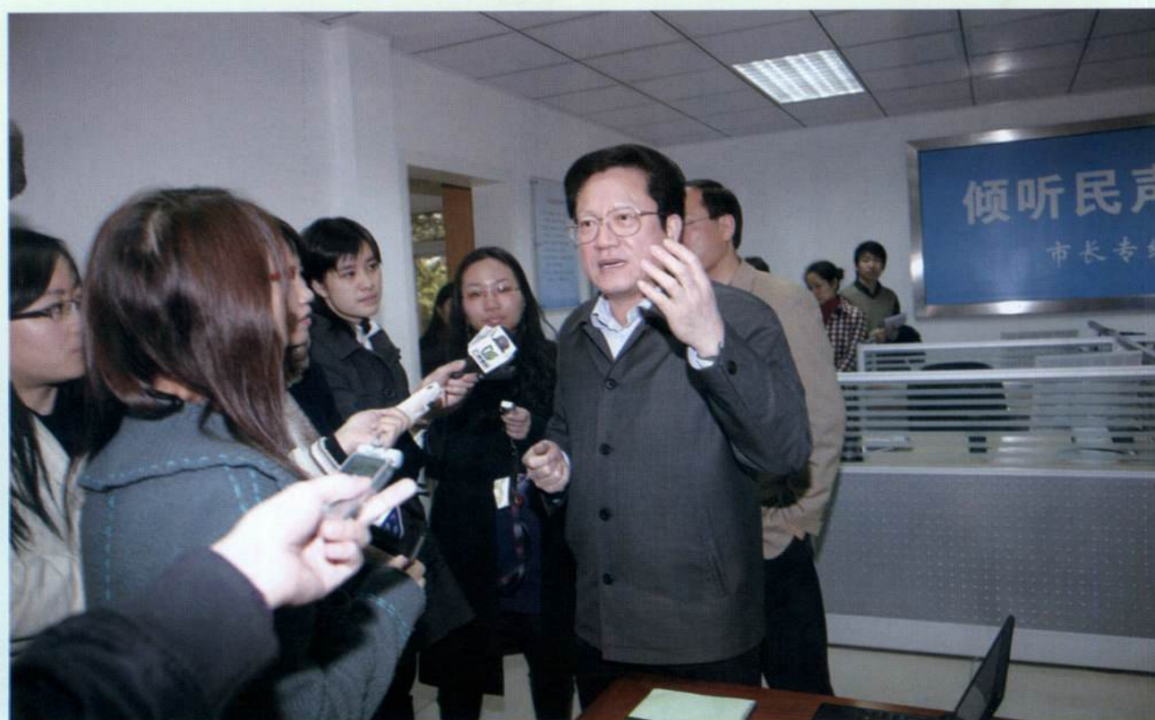
▲ 市长张广宁接受记者采访。