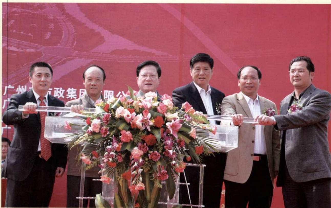
▲ 2月5日，市长张广宁启动广州新客站地区综合开发项目奠基仪式。