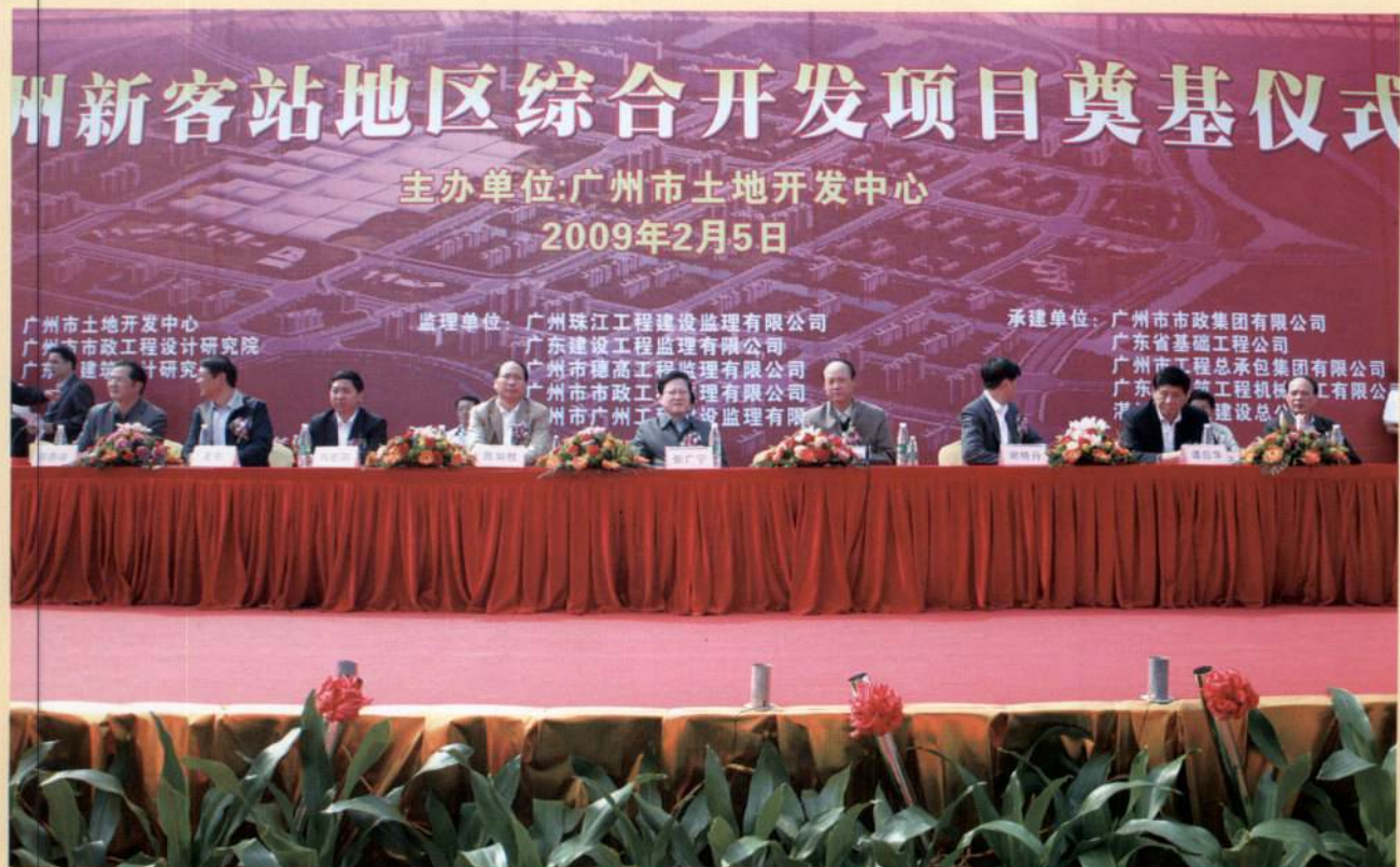
▲ 市长张广宁等领导嘉宾出席开工仪式。