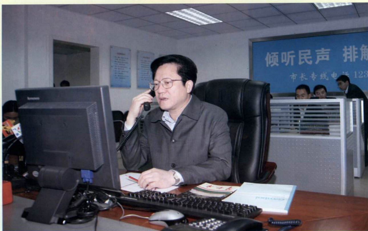
▲ 1月23日上午9时整，市长张广宁准时来到12345市长热线接听电话。