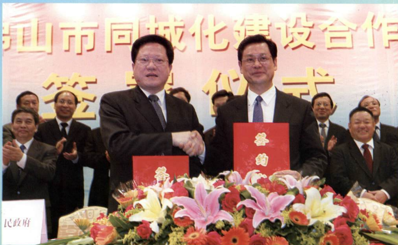
▲ 3月19日，广州市市长张广宁与佛山市市长陈云贤签署同城化建设合作框架协议。