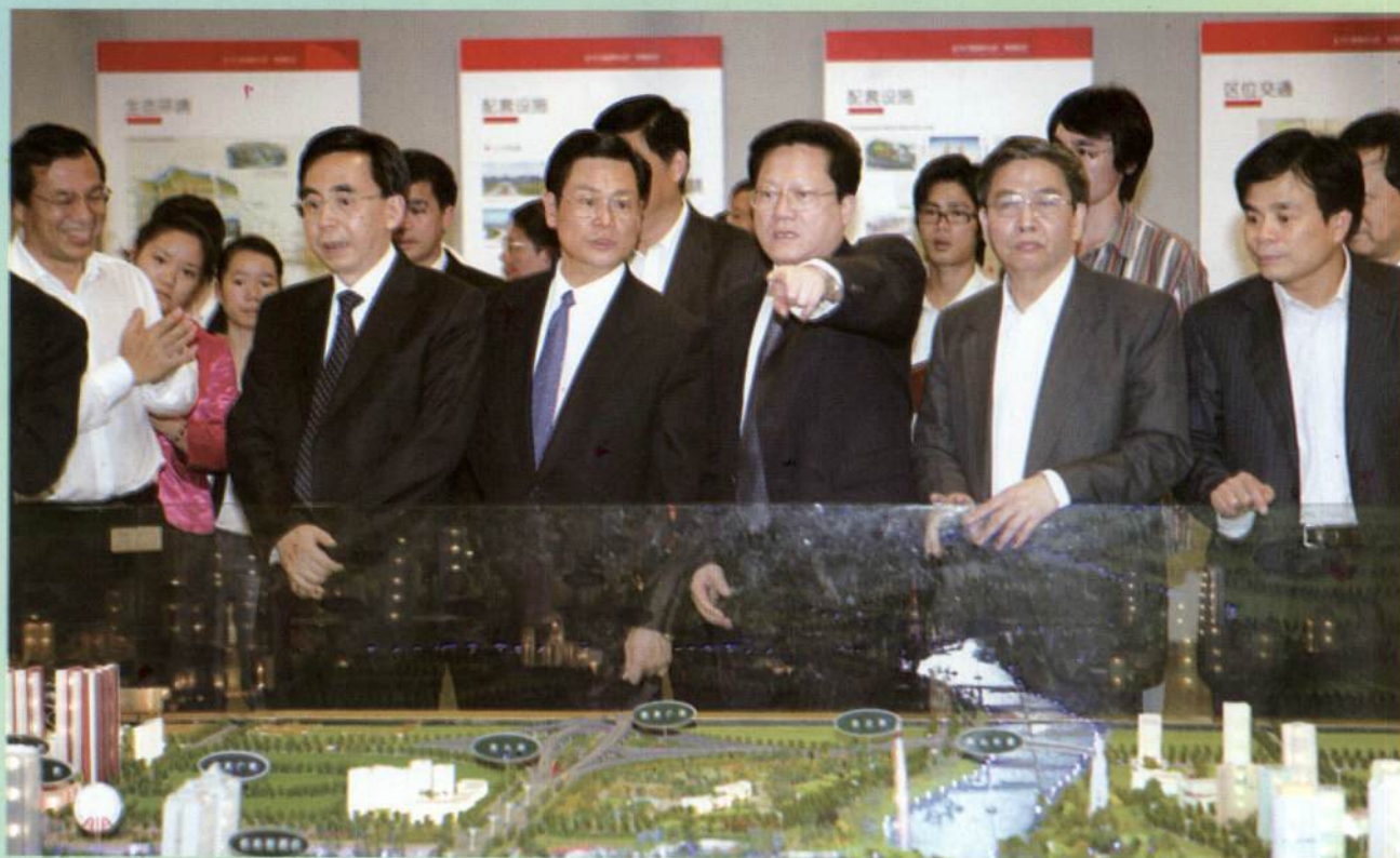
▲ 省委常委、广州市委书记、市人大常委会主任朱小丹，市委副书记、市长张广宁和市政协主席朱振中率领广州市党政考察团赴佛山考察。