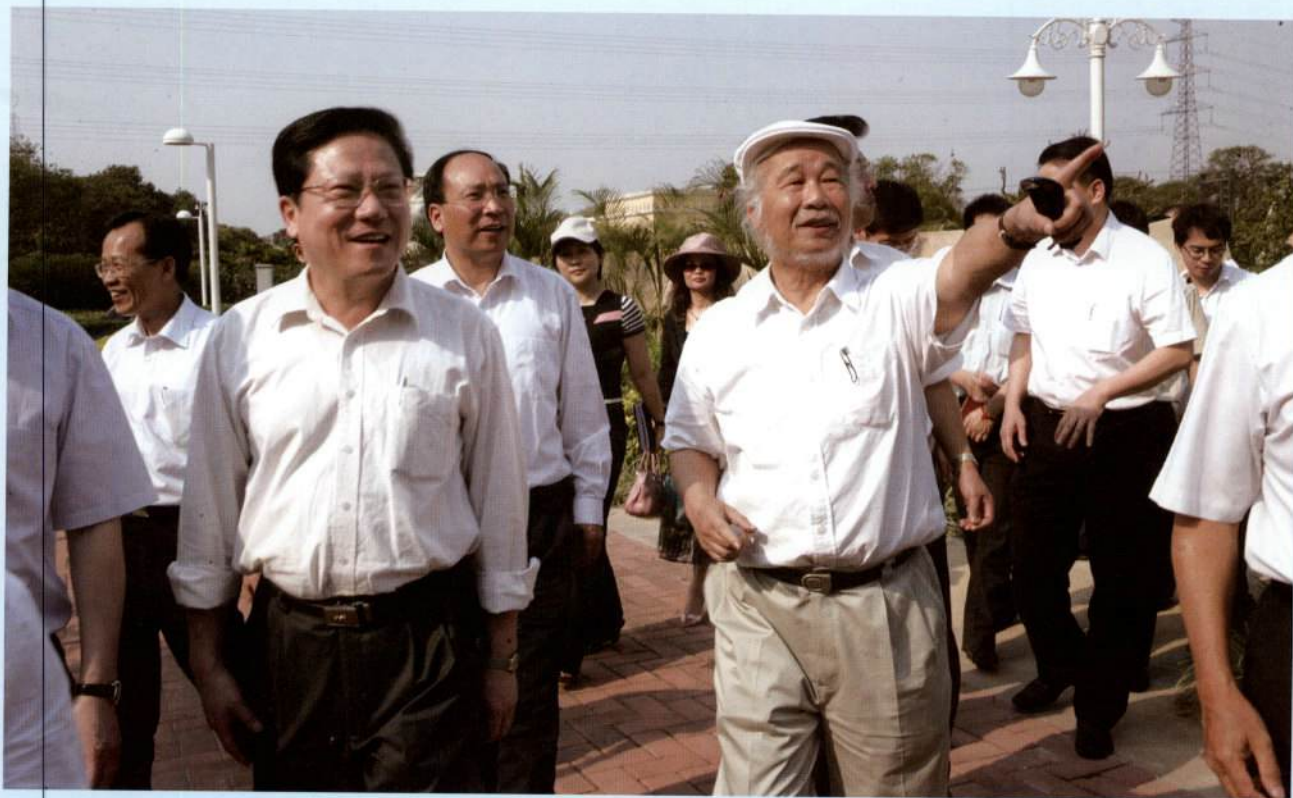
▲ 市长张广宁前往海珠区检查南洲路、潘鹤雕塑艺术园、龙潭果树公园和西碌涌的建设和整治情况。