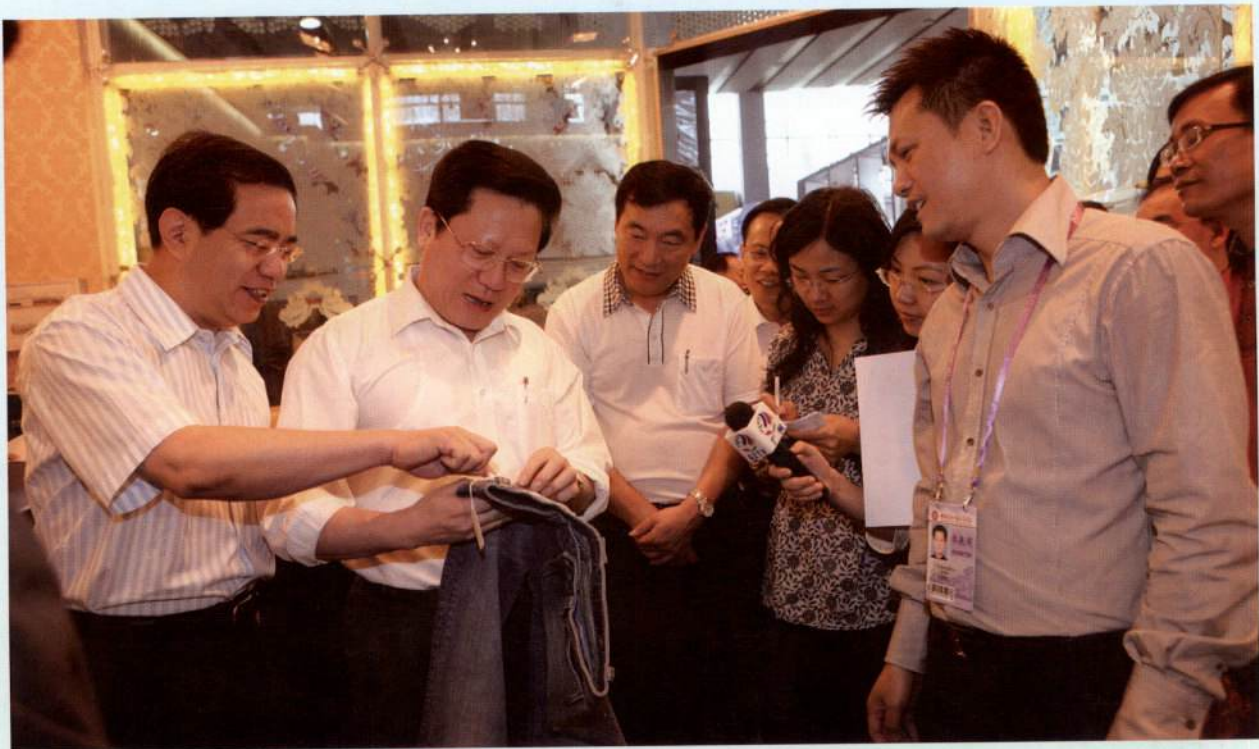
▲ 5月7日，市长张广宁前往广交会调研广州外贸出口工作。