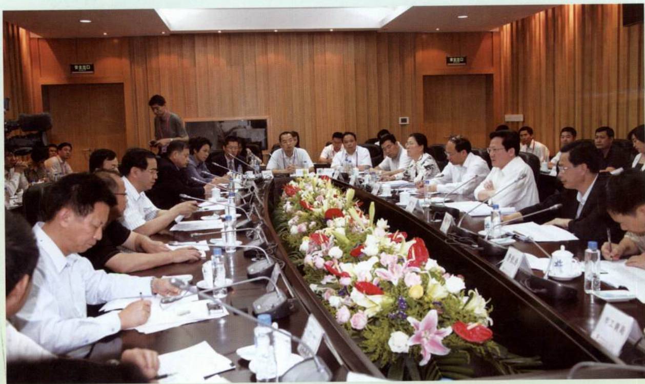
▲ 市长张广宁与参展企业代表进行座谈。