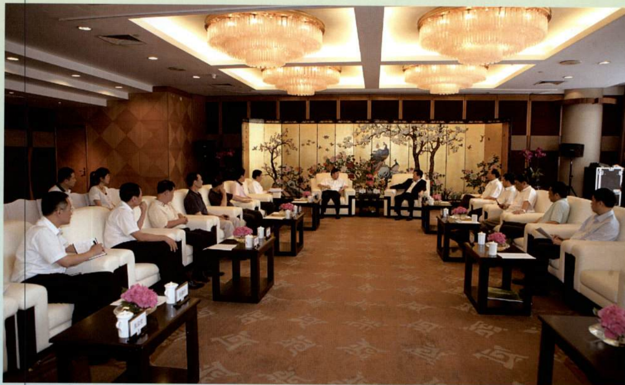
▲ 市长张广宁会见前来广东、广州调研的新华社党组成员、副社长鲁炜一行。