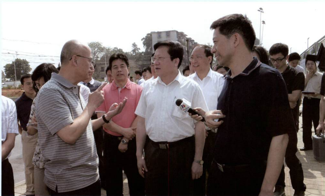
▲ 5月8日，市长张广宁前往黄埔区调研。