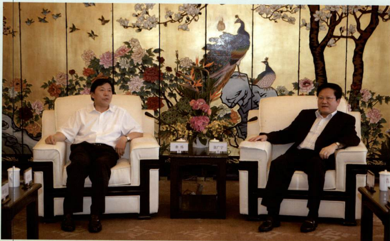
▲ 5月10日，市长张广宁与新华社党组成员、副社长鲁炜亲切交谈。