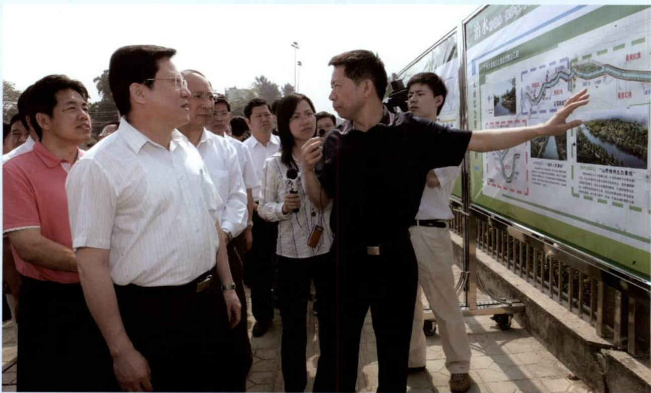
▲ 市长张广宁一行前往黄埔区临港商务区鱼木地块，考察该区规划情况。