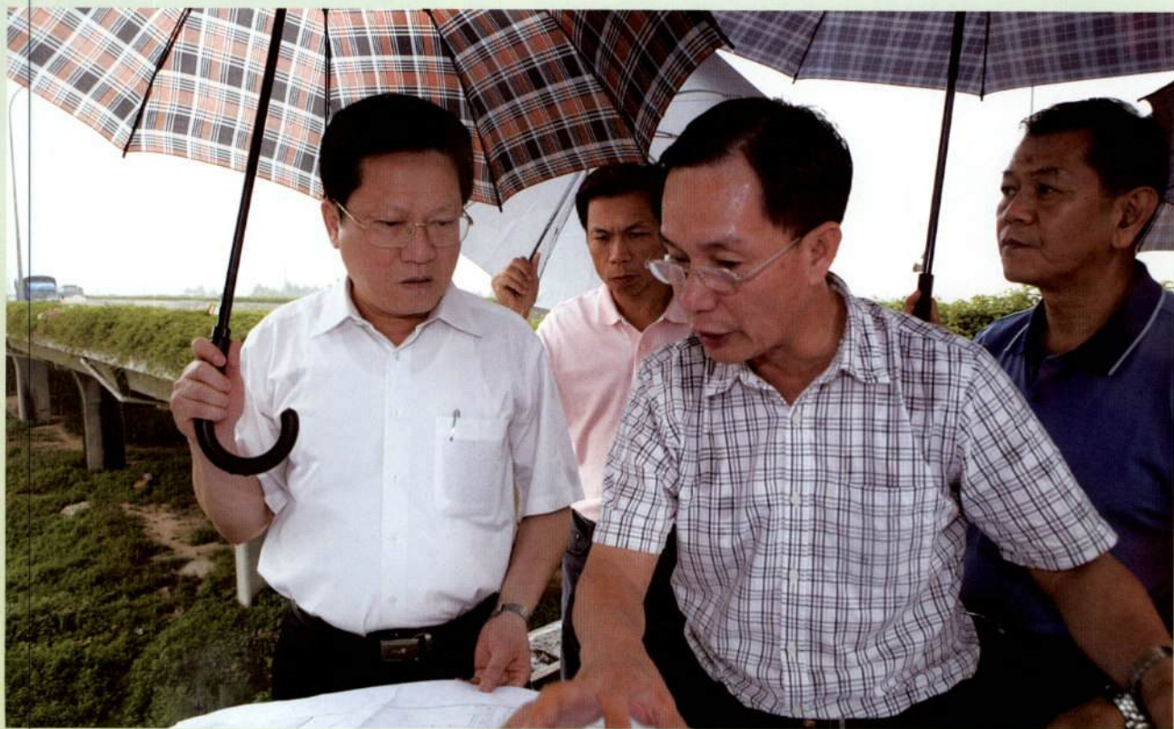
▲ 8月12日，张广宁市长一行前往新光快速路等地调研（一）。