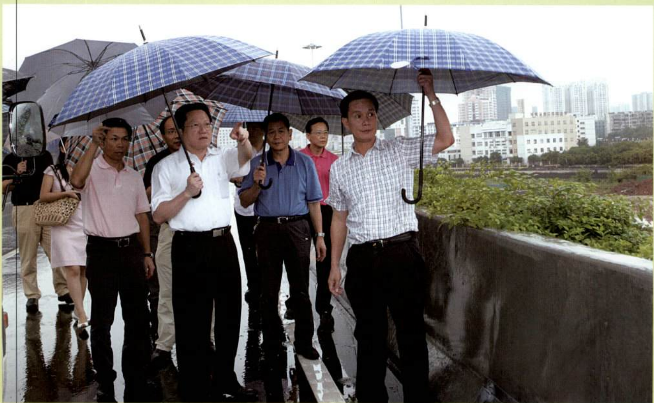
▲ 张广宁市长一行前往新光快速路等地调研（二）。