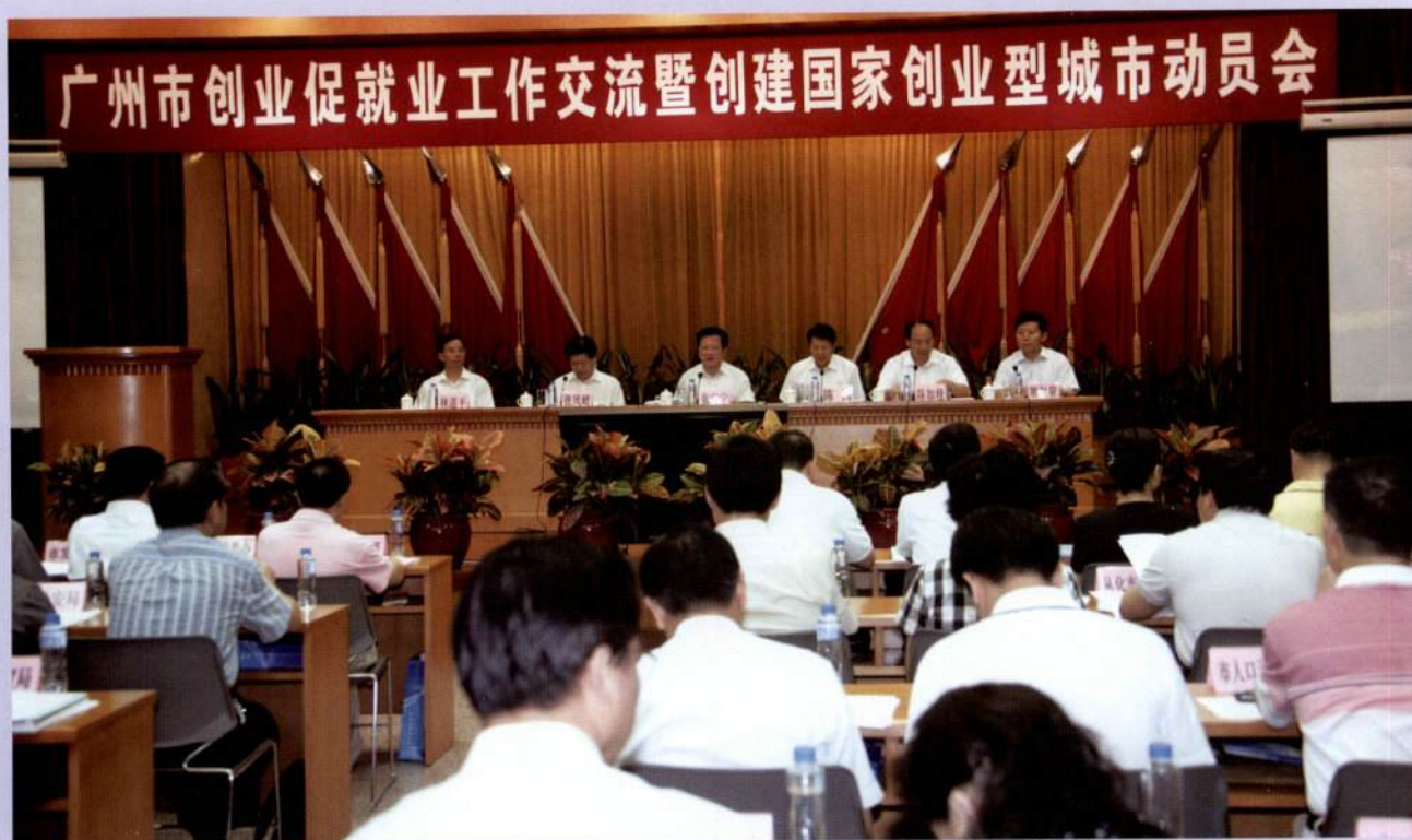
▲ 广州市创业促就业工作交流暨创建国家创业型城市动员会大会现场。