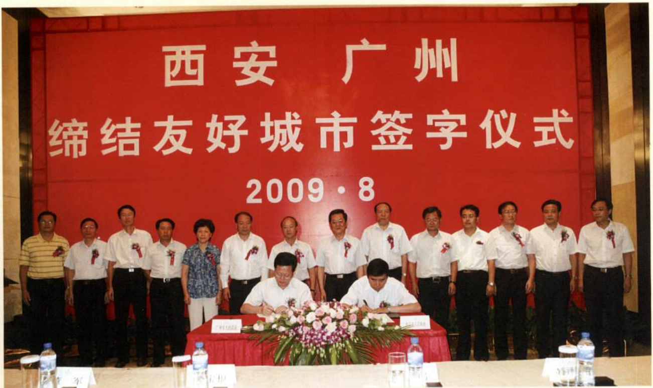
▲ 8月14日上午，广州与西安两市举行缔结友好城市签字仪式。