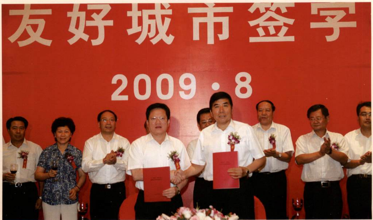
▲ 广州市市长张广宁和西安市市长陈宝根分别在仪式上签字并亲切握手。