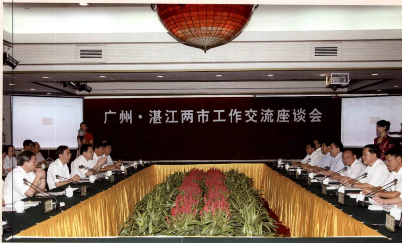
▲ 8月17日下午，省委常委、广州市委书记、市人大常委会主任朱小丹在广州主持召开广州·湛江两市工作交流座谈会，研究深化两市合作发展大计。