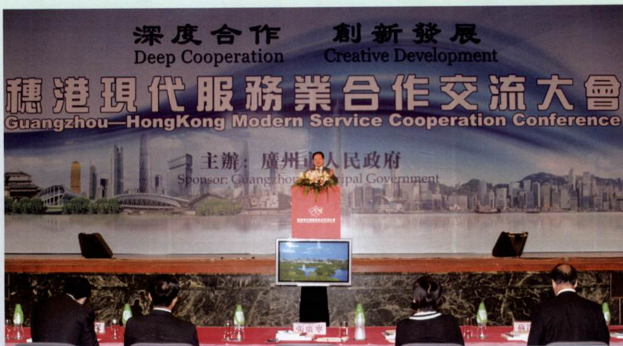
▲ 由广州市政府主办的“深度合作 创新发展——穗港现代服务业交流会”于2009年8月20日上午在香港会展中心举行。