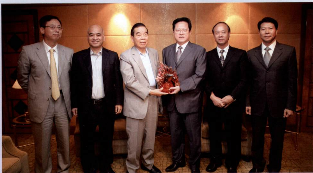
▲ 市长张广宁会议期间看望香港企业代表。