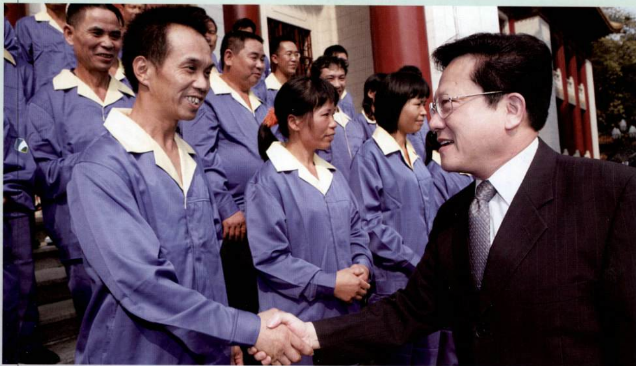
▲ 10月26日，市长张广宁亲切接见了71位2009年度“优秀城市美容师”和“羊城市容环卫杯”竞赛获奖单位代表。