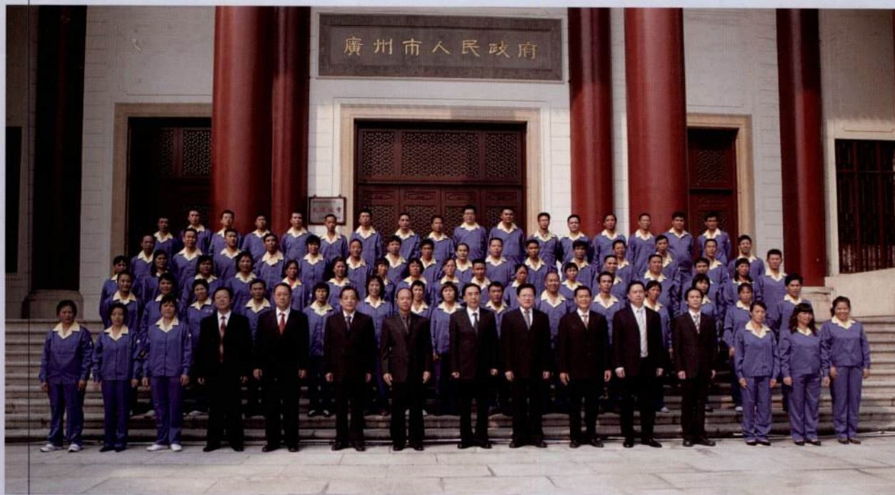
▲ 市委书记朱小丹，市长张广宁与“优秀城市美容师”和“羊城市容环卫杯”竞赛获奖单位代表合影留念。