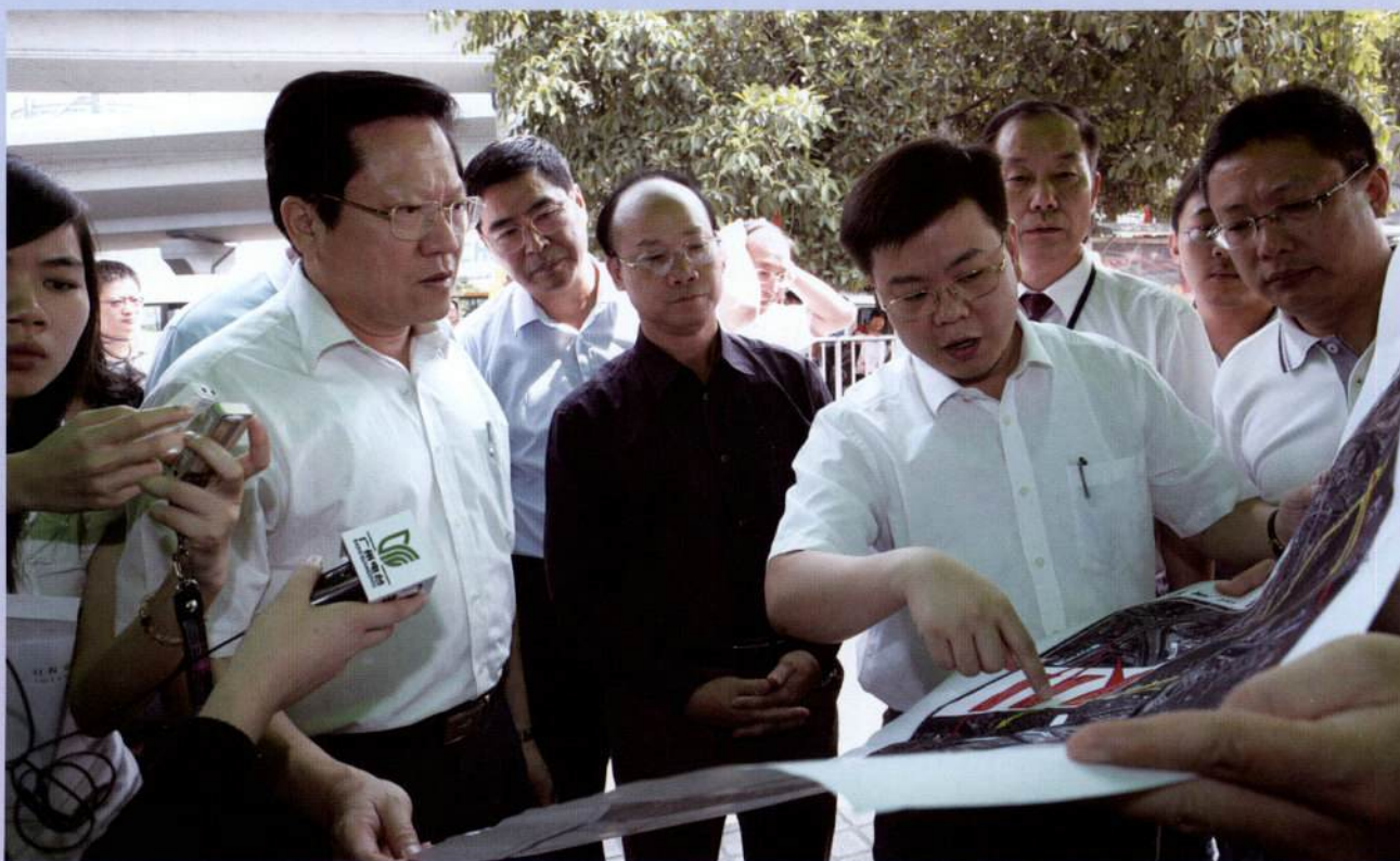
▲ 市长张广宁一行调研全市交通综合整治问题（二）。