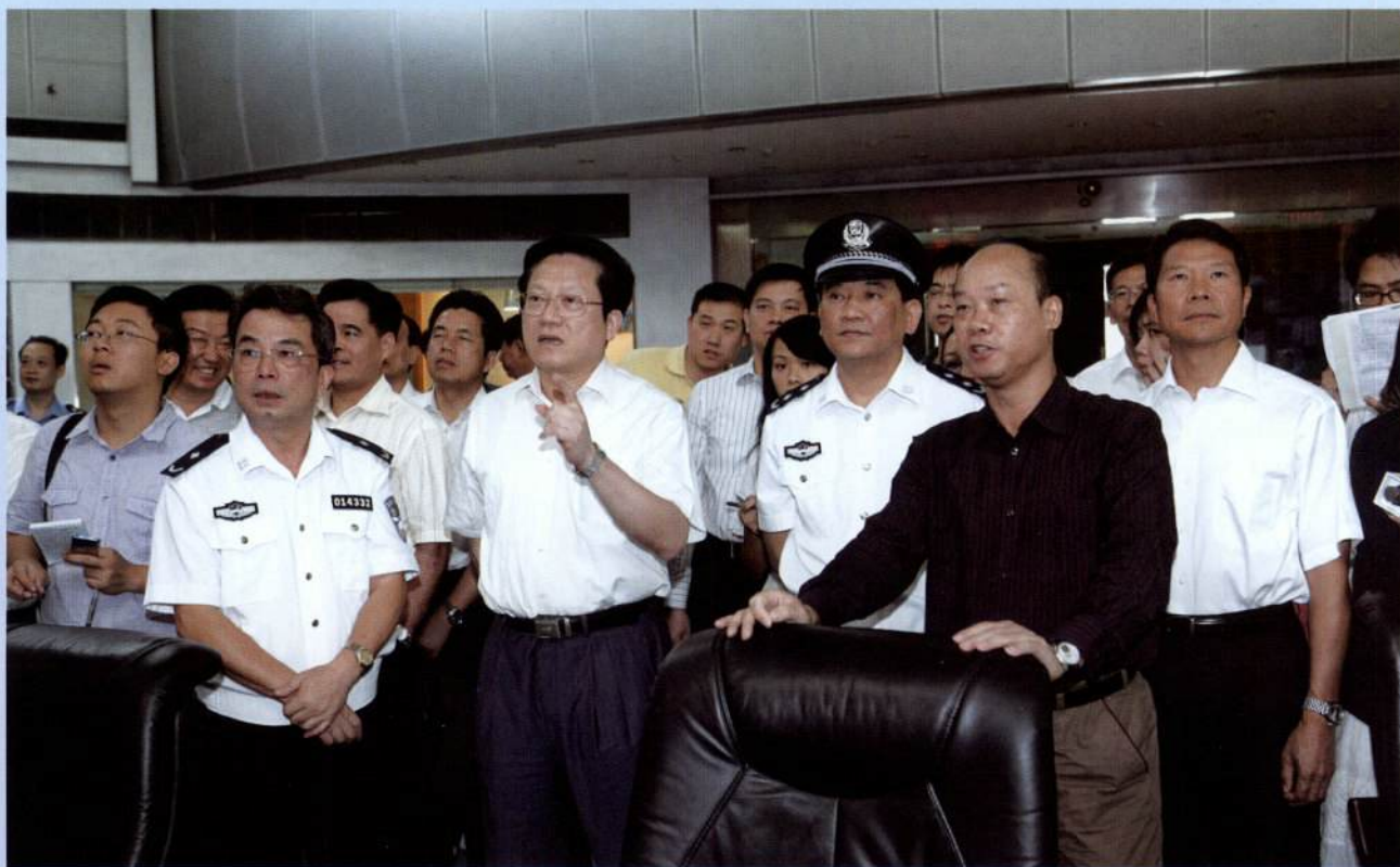
▲ 10月9日上午，市长张广宁一行调研全市交通综合整治问题（一）。