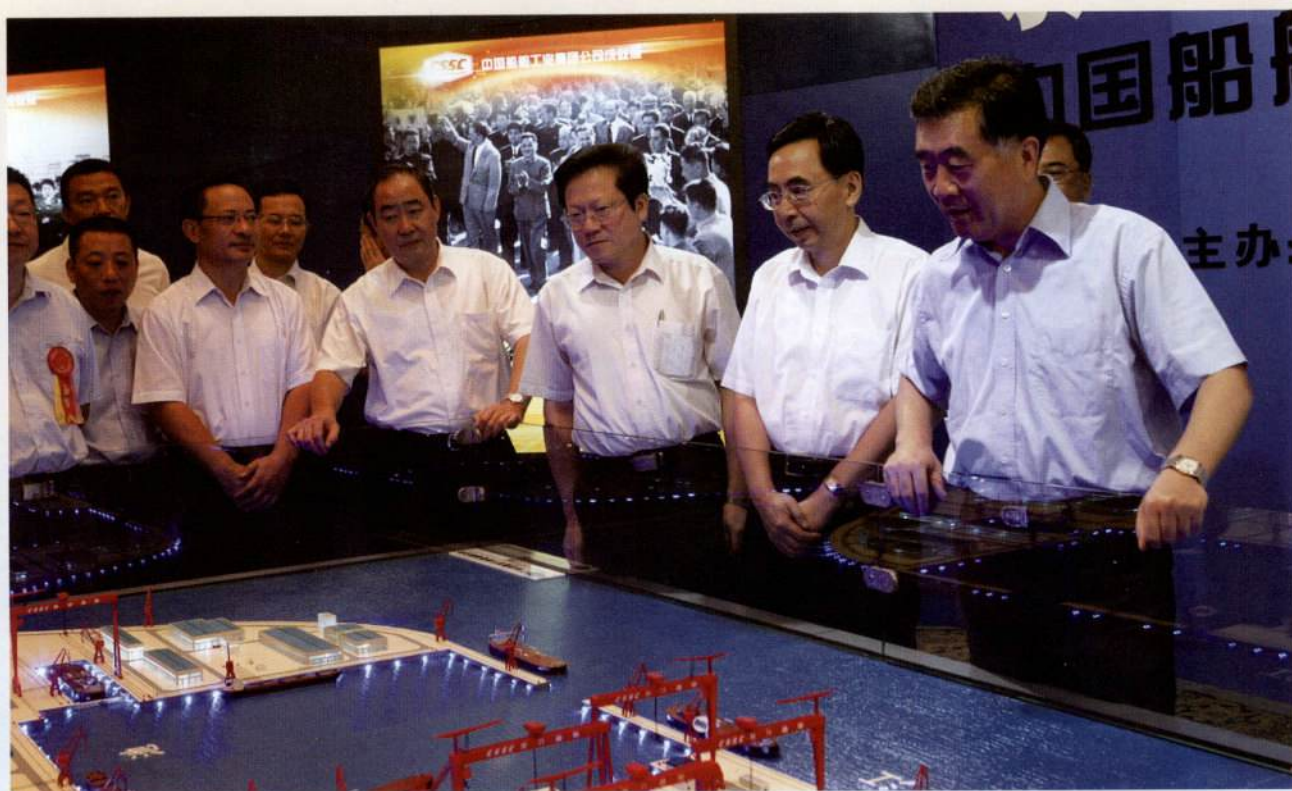
▲ 10月15日，省委书记汪洋，市委书记朱小丹，副省长佟星，市长张广宁，中国船舶工业集团公司总经理谭作钧、党组书记李宏等参观了中船集团成就展。