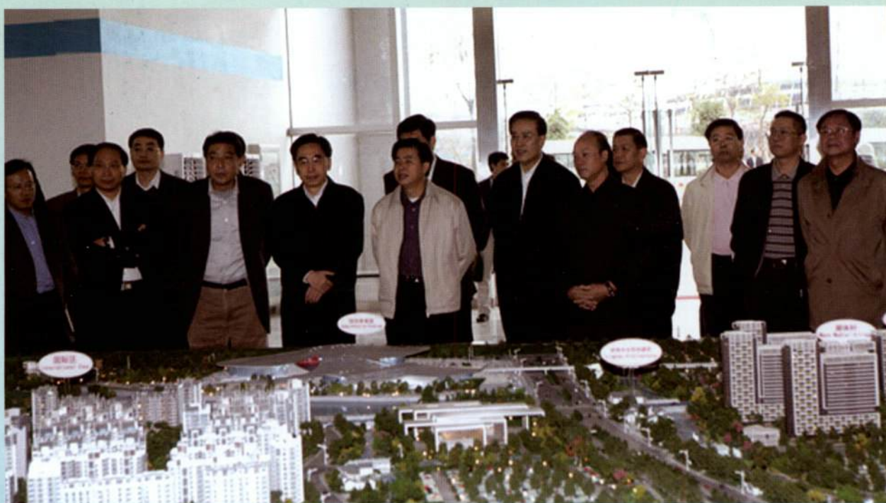
▲ 12月9日，省长黄华华率领省直有关部门的负责同志到广州市检查亚运场馆和交通基础设施建设进展情况。