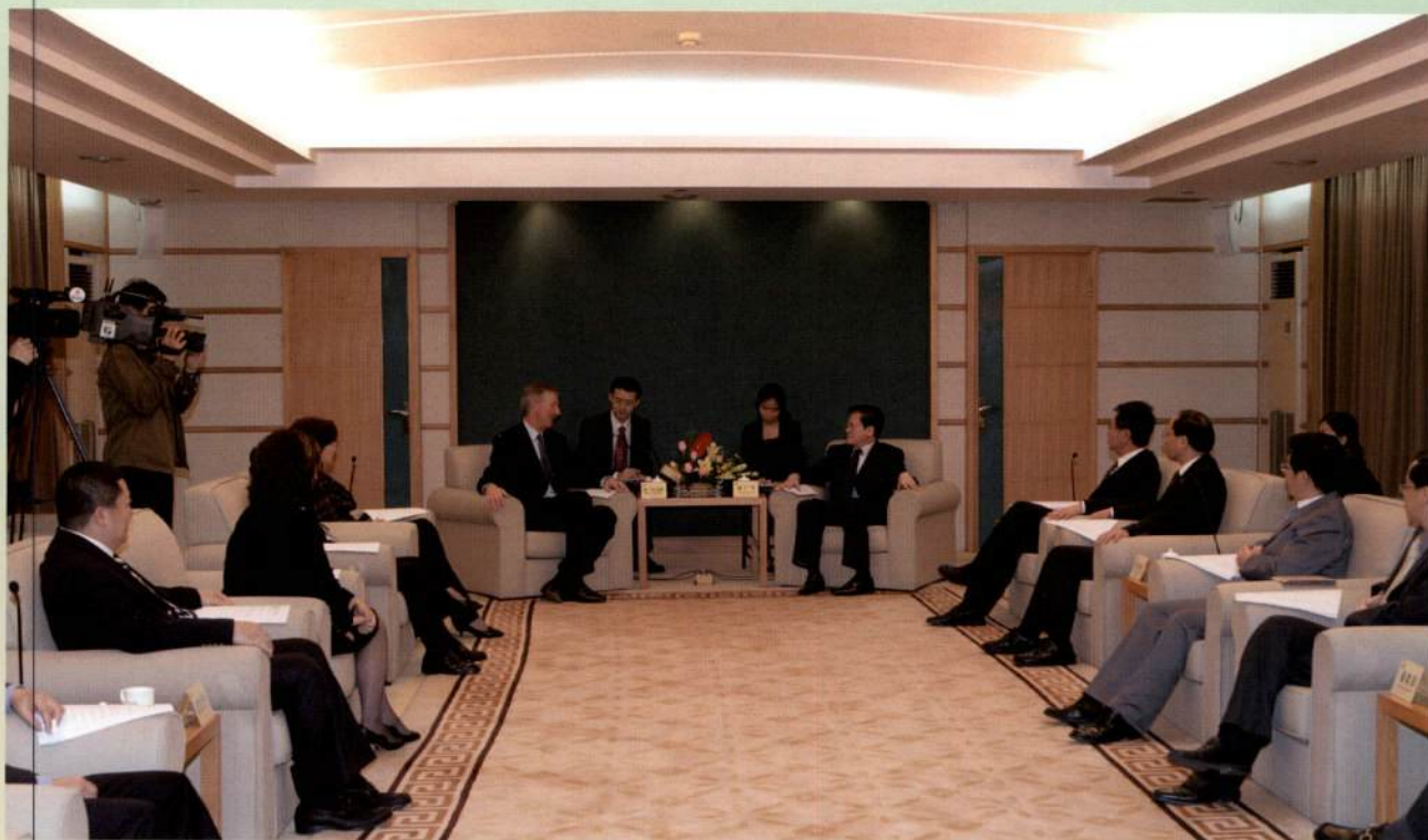
▲ 12月4日，市长张广宁会见美国安达高公司董事长、安利公司董事会主席史提夫·温安洛一行。