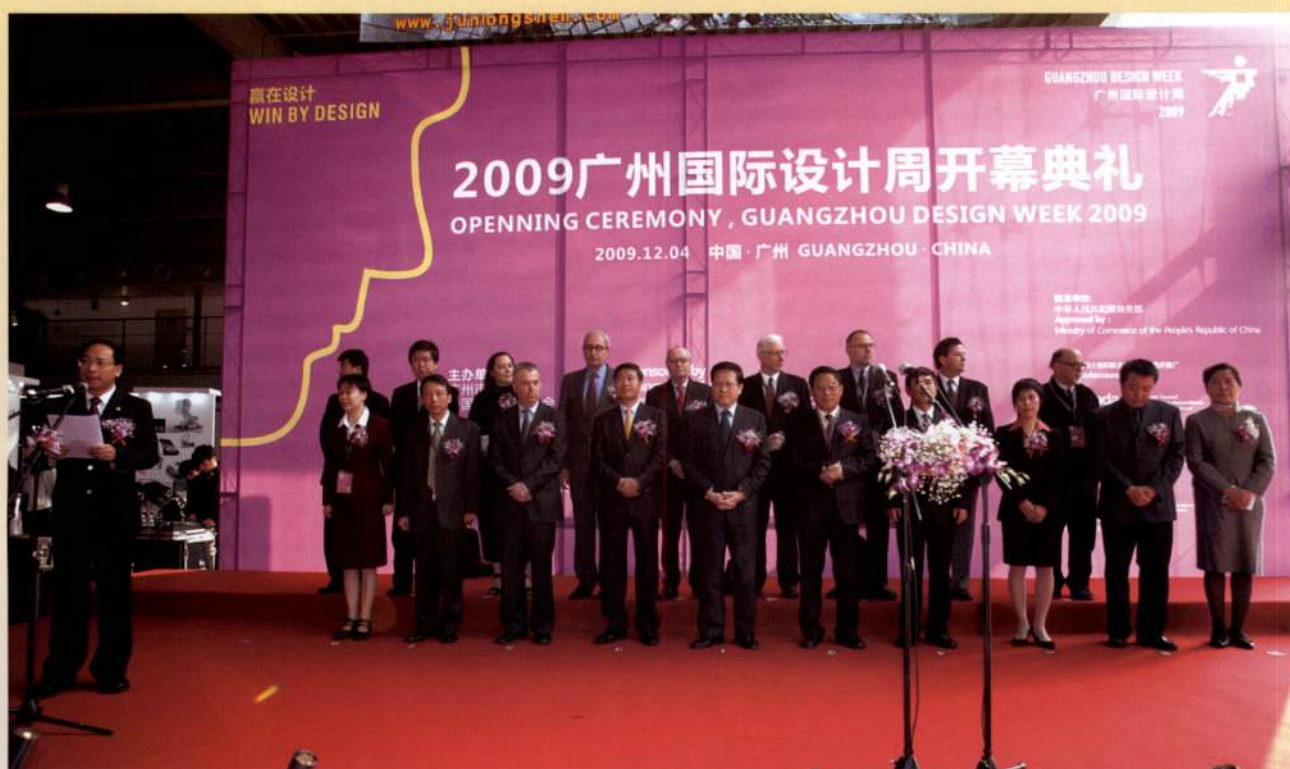
▲ 12月4日，市长张广宁参加2009广州国际设计周开幕式。