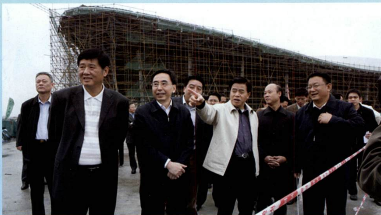
▲ 省长黄华华考察广州亚运城的建设施工情况。